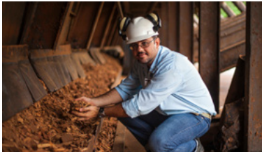
Brasilien Strom aus FSC-Holzabfall im Amazonas