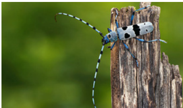
Schweiz Tier-, Natur- und Klimaschutz

Mit einem kleinen, auf Ihren Auftrag bezogenen Beitrag unterstützen Sie hochwertige myclimate Klimaschutzprojekte.