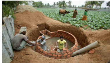
Indien Bau von Biogasanlagen