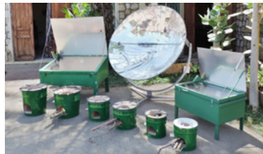
Madagaskar Solarkocher und effiziente Kocher