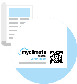
Label mit Trackingnummer